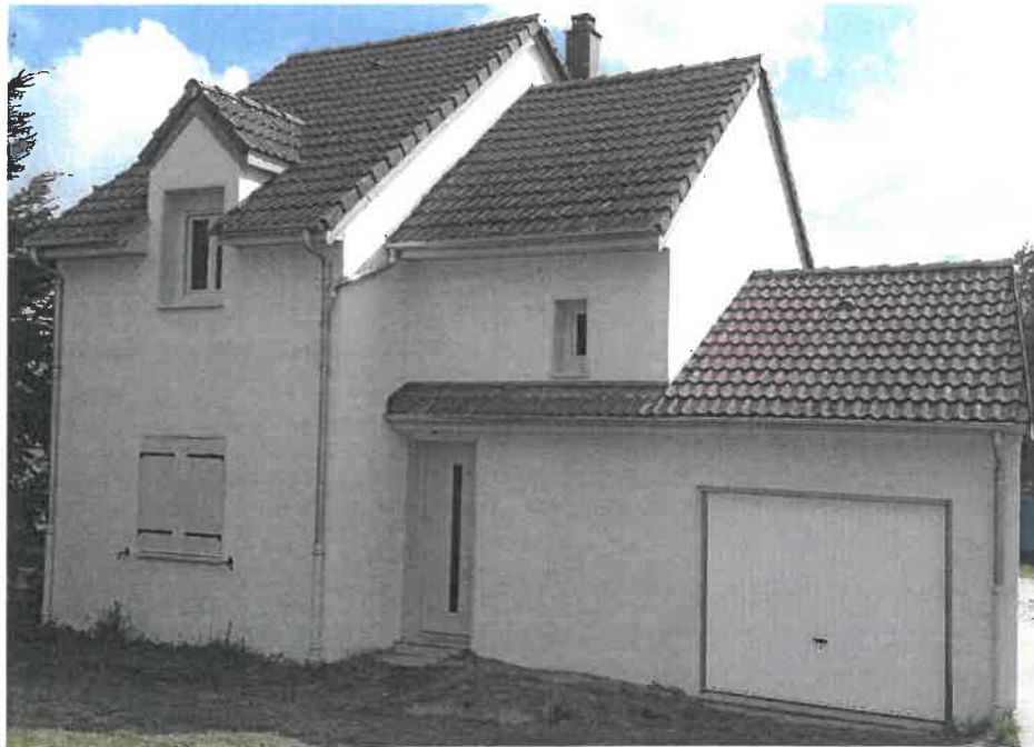
Moux-en-Morvan – Les Hâtés